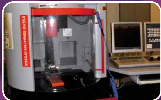
Centre d'usinage à commande Numérique