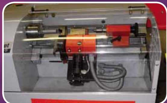
Tour à commande Numérique