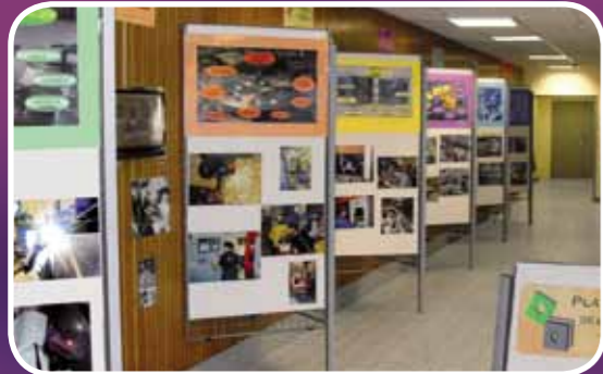
Plateforme des métiers